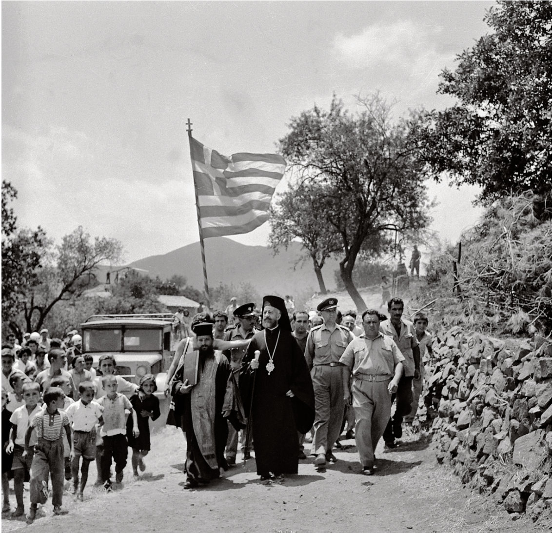
Ο Μακάριος επισκέπτεται το χωριό Πηγαίνια, στην περιοχή της Τηλλυρίας, όπου επικρατούσε ένταση λόγω των προστριβών με τους Τούρκους του θύλακα Μανσούρας – Κοκκίνων.

των Συμφωνιών της Ζυρίχης χωρίς να μπορεί η Τουρκία να αντιδράσει, ενώ προειδοποιούσε δημόσια τους Τουρκοκυπρίους και την Τουρκία ότι είχε τα μέσα να εκκαθαρίσει όλους τους θύλακες και να αποκρούσει τουρκική εισβολή. Η αυτοπεποίθηση με την οποία ο Μακάριος διακήρυττε και εφάρμοζε την πολιτική του εδραζόταν αφενός στην πεποίθησή του ότι οι ΗΠΑ δεν θα επέτρεπαν έναν ελληνοτουρκικό πόλεμο και αφετέρου στη στήριξη που αισθανόταν ότι είχε από τη Σοβιετική Ένωση. Παίζοντας τη μια υπερδύναμη εναντίον της άλλης, θεωρούσε ότι θα έφτανε στον στόχο του.