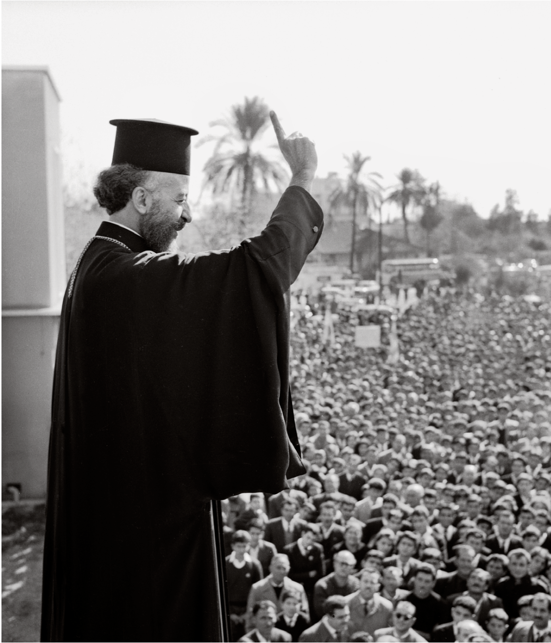
Στις 3 Φεβρουαρίου 1964, ο Μακάριος απευθύνεται σε διαδηλωτές από τον εξώστη της Βουλής, ενώ στο Προεδρικό τον περιμένει ο Αμερικανός πρέσβης, για να του επιδώσει προσωπικό μήνυμα του προέδρου των ΗΠΑ Λίντον Τζόνσον.