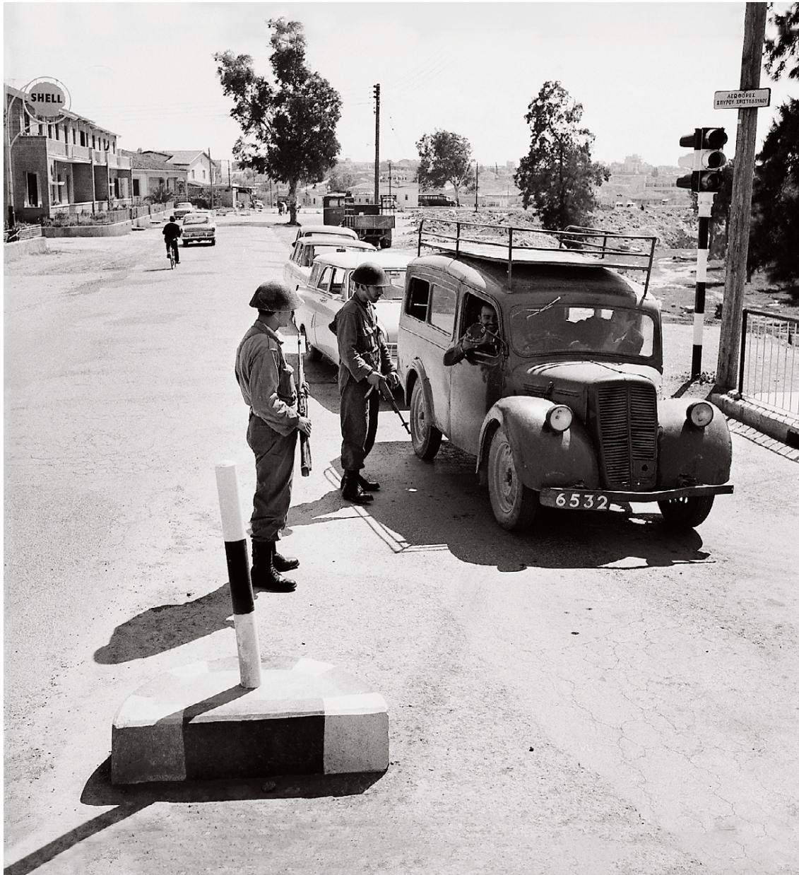
Μέλη της Οργάνωσης σε σημεία ελέγχου στη Λευκωσία, μετά την έναρξη των διακοινοτικών συγκρούσεων.