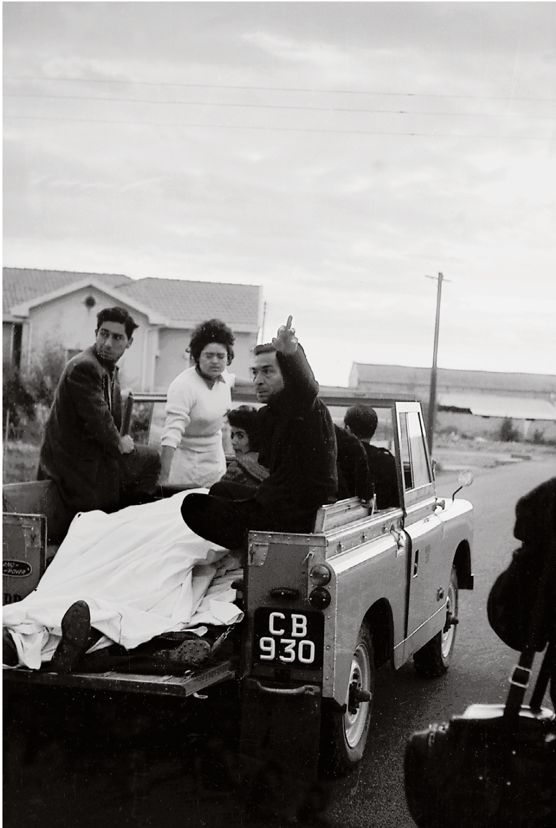
Οι πρώτοι νεκροί των διακοινοτικών συγκρούσεων μεταφέρονται στα νοσοκομεία.