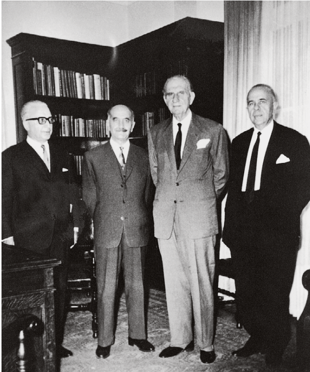
Ο Γεώργιος Παπανδρέου με τον Γεώργιο Γρίβα, ύστερα από συνάντηση που είχαν στο Καστρί. Δεξιά του Γρίβα ο Πέτρος Γαρουφαλιάς και αριστερά του Παπανδρέου ο Σταύρος Κωστόπουλος.

Η εκδήλωση αυτή έγινε ενόψει της προγραμματισμένης για τις 11 Απριλίου επίσκεψης του Μακάριου στην Αθήνα για συνομιλίες με την ελληνική κυβέρνηση, με πρώτο θέμα στην ατζέντα την άμυνα της Κύπρου. Εκείνη τη χρονική περίοδο άρχισε να εκδηλώνεται ανοιχτά υπέρ του Γρίβα και ο Πολύκαρπος Γιωρκάτζης. Οι διάφοροι σύνδεσμοι αγωνιστών που είχε ιδρύσει και χρηματοδοτούσε (ΕΑΛ, ΣΑ-ΠΕΛ κ.λπ.) άρχισαν να εκδίδουν ανακοινώσεις προτείνοντας την κάθοδο του Γρίβα. Ανάλογους μηχανισμούς είχε δημιουργήσει ο Γιωρκάτζης και μέσα στα γυμνάσια, και άρχισε να κινητοποιεί τους μαθητές σε διαδηλώσεις υπέρ του Γρίβα και της ένωσης. Τις παραμονές της αναχώρησης του Μακάριου για την Αθήνα πραγματοποιήθηκαν πλείστες όσες τέτοιες διαδηλώσεις. Η συνείδηση που δημιουργήθηκε τότε στον κόσμο ήταν πως η ένωση δεν ήταν δύσκολο να επιτευχθεί, φτάνει να υπήρχε ταυτότητα στόχων μεταξύ του Μακάριου και του Γρίβα.