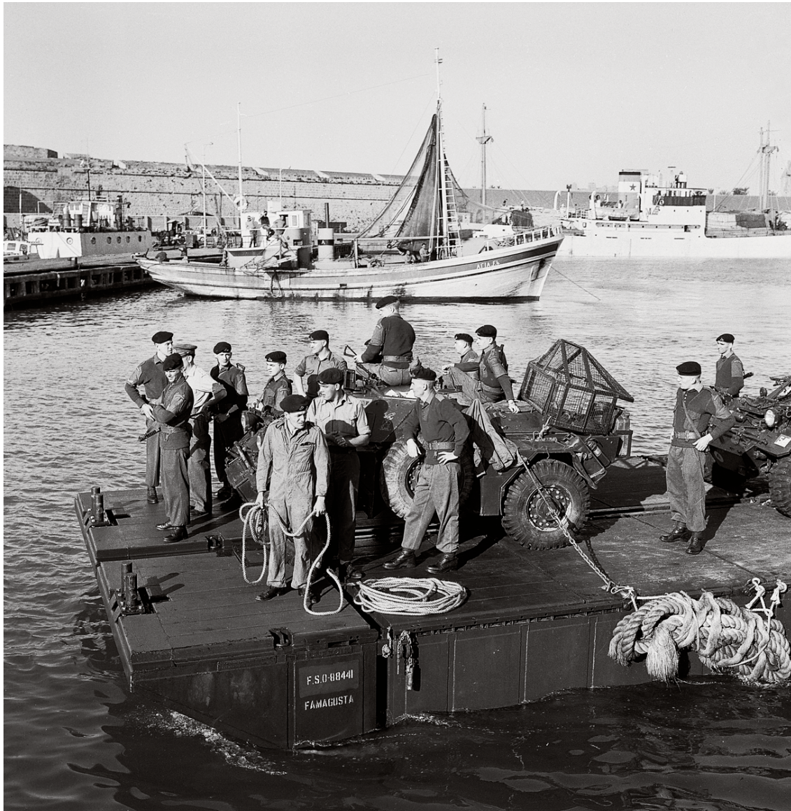
Η άφιξη των πρώτων ανδρών της Ειρηνευτικής Δύναμης των Ηνωμένων Εθνών στην Κύπρο.