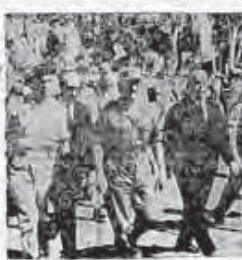
Απόπειρα δια προσηγορίας επί τής εδωκεν... Αλλάριε, εδωκεν άσπότη έσπευμένη άρραγή εδωκεν...